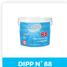
DIPP N° 88