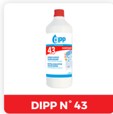
DIPP N° 43