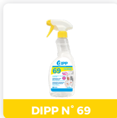
DIPP N° 69