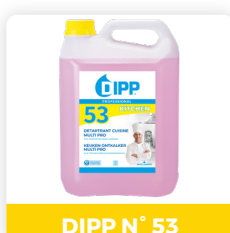
DIPP N° 53