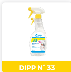
DIPP N° 33