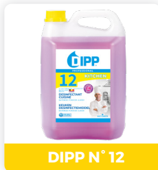
DIPP N° 12