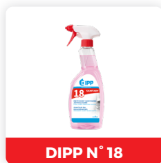
DIPP N° 18