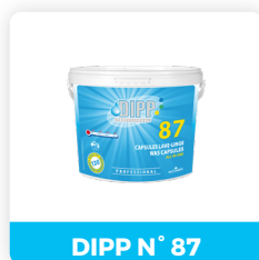
DIPP N° 87