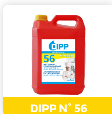
DIPP N° 56