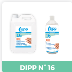
DIPP N° 16