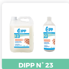
DIPP N° 23