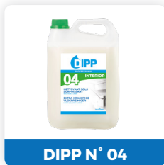
DIPP N° 04