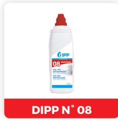
DIPP N° 08