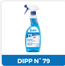
DIPP N° 79