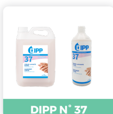
DIPP N° 37