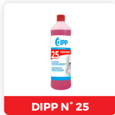
DIPP N° 25